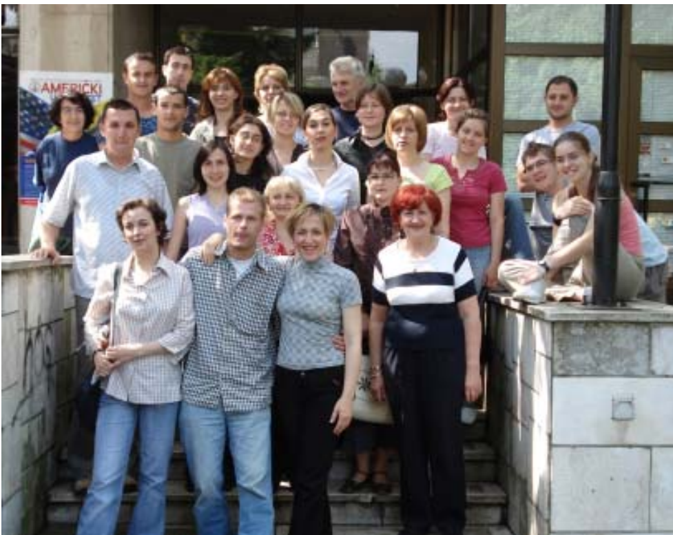
Ein Teil der örtlichen Mitarbeiterinnen und Mitarbeiter aus Bosnien, Kroatien und Serbien beim Vorbereitungsseminar in Tuzla

In Neum, der bosnischen Enklave am Mittelmeer, trafen sich in vier Gruppen je 100 Jugendliche aus den drei Bevölkerungsteilen Bosniens, aus Serbien und aus Kroatien. Die Kontakte verliefen völlig reibungslos. Viele neue Freundschaften wurden geschlossen. Sowohl Jugendliche als auch die Betreuerinnen und Betreuer berichteten, dass in Bosnien unter der scheinbar friedlichen Oberfläche starke Spannungen zu spüren seien. Die verschiedenen Volksgruppen haben wenig Kontakte untereinander, Beziehungen zu den "Anderen" bezeichneten die Jugendlichen als extrem schwierig bis undenkbar. Die mögliche Unabhängigkeit des Kosovo bereitet vielen Menschen in Bosnien Sorgen, weil sie befürchten, dass dann der serbische Teil Bosniens, die Republik Srpska, ebenfalls in einem Referendum die Selbständigkeit fordern bzw. sich an Serbien anschließen könnte. Ein Betreuer schätzte im Interview die Situation ähnlich explosiv ein wie 1991.