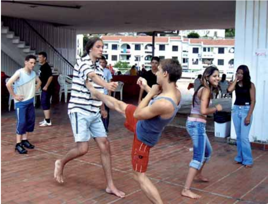
Kung Fu-Workshop; Foto: Edgar Weick

Ich habe so viel positive Energie während des Workshops empfunden, und es war wunderbar, während des Lernens die glücklichen Gesichter der Kinder zu sehen. Sie lernten zu kämpfen, aber nicht nur physisch mit Armen und Beinen, sondern psychisch mit dem Herzen und ihrem Kopf.“