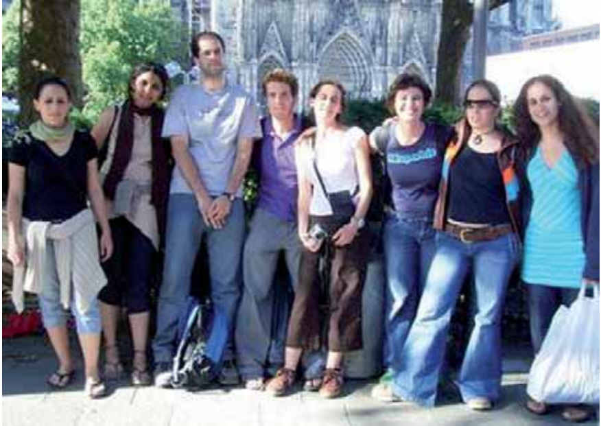
Gruppe Breaking Barriers

Nach einem Tag Erholung bei einem Ausflug sollte es am fünften Arbeitstag wieder um den Begriff des Terrors und die Bedeutungen, die er für die verschiedenen Seiten hat, gehen. Die israelischen Reaktionen auf die Anklagen der Palästinenser liefen manchmal auf Verleugnungen hinaus: „Die IDF (Israel Defense Forces = israelische Armee; H.D.) machen so etwas nicht mit Absicht; wenn Zivilisten getötet werden, kann es sich nur um Unfälle handeln“ usw.