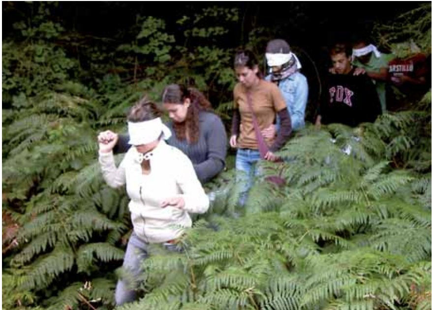
Vertrauensspiele im deutschen Dschungel

waren nicht das vorab gesteckte Ziel, ergaben sich aber aus dem Prozessverlauf.