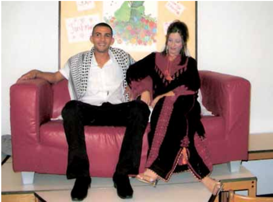
Eine „palästinensische Hochzeit“ beim Kulturabend

Bei den Dialog-Seminaren zwischen jungen Menschen aus Israel und Palästina gestaltet das deutsche Team den Rahmen für eine Atmosphäre empathischer Akzeptanz und Gleichberechtigung. Seine Mitglieder versuchen, eine Position professioneller Distanz einzunehmen. Das bedeutet nicht Neutralität, sondern Allparteilichkeit. Das ist natürlich umso schwieriger, je ausgeprägter die Loyalität, aus biografischen oder politischen Gründen, zu einer der Konfliktparteien sein mag. Das gilt im Prinzip für Freizeiten mit Albanern und Serben im Kosovo genauso wie für Freizeiten mit Israelis und Palästinensern in Deutschland, bei denen allerdings Emotionen eine größere Rolle spielen.